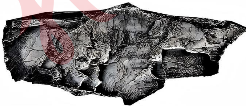
图 1 尕日塘秦刻石渲染图