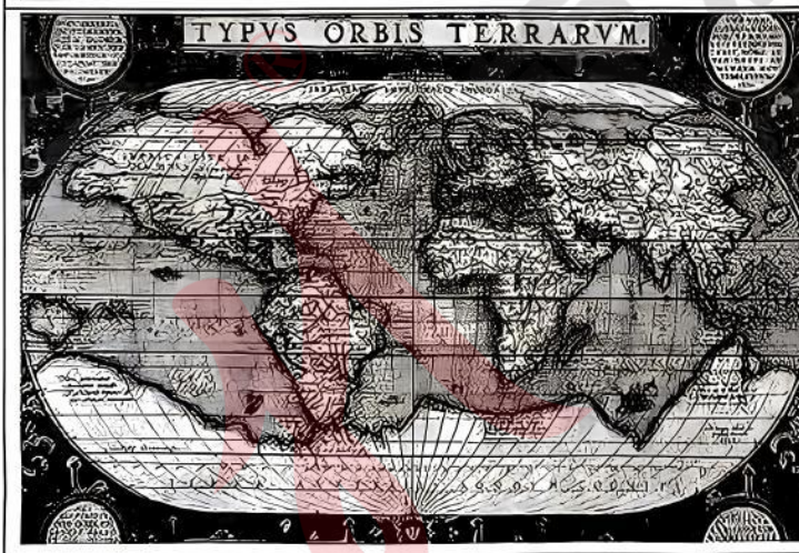
图3为1570年出版的亚伯拉罕·奥特柳斯《寰宇全图》，以椭圆形投影展现全球，标注了美洲、非洲、亚洲及“未知的南方大陆”，并用拉丁文引用古罗马哲学家西塞罗的名言：“对于那些有幸获得永恒事物认知的人来说，人类事务中还有什么能显得伟大呢？”

图2为1482年出版的托勒密世界地图，以平面投影呈现地中海为中心的“已知世界”，标注了欧洲、非洲北部和亚洲西部，四周环绕着象征四大元素(土、水、气、火)的头像。