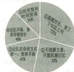
图表2 高中生语文背诵困难类型